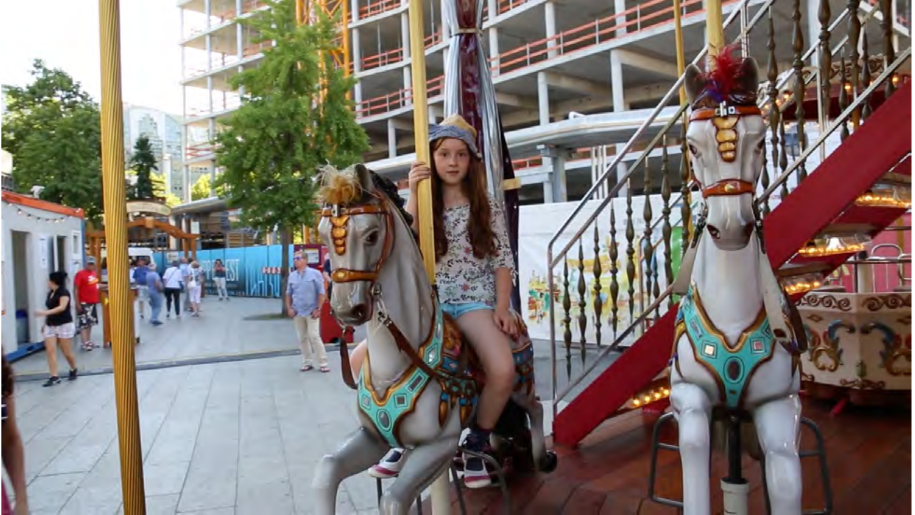
Capture d'écran 'A Berlin Childhood around 1900—A Project in Progress.' 'Carousel' (2017), © Aura Rosenberg, Frances Scholz, aimablement fourni par Galerie Clages (Cologne) et Martos Gallery (NY)

Pour l'artiste, l'association de tous les éléments de la création révèlent les réflexions «identiques» entre Benjamin et Salles.