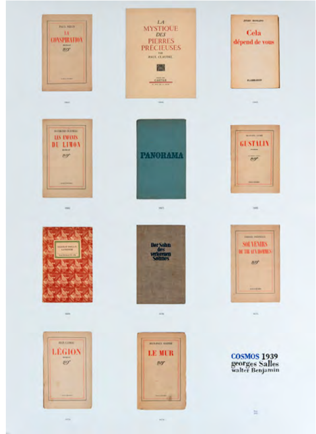
© Jean-Michel Alberola / Adagg, Paris, 2020

en 1939. 53 livres exposés sont les ouvrages inscrits sur la liste des lectures personnelles de Benjamin en 1939, retrouvés et collectionnés en éditions originales par le libraire Jean-Yves Lacroix et Jean-Michel Alberola. Parmi ces lectures, Le Regard de Georges Salles. Georges Salles (1889–1966), conservateur du département des arts asiatiques au musée du Louvre, publie en 1939 un recueil de réflexions sous le titre Le Regard . Ce qui unit tous les hommes serait, d'après Salles, l'œil hanté, qui façonnerait à chaque instant le monde au schéma de son cosmos. Salles décrit le regard sur l'art comme une expérience organique , un plaisir de gastronome, que l'on trouve non seulement au musée, mais aussi en flânant dans les rues de Paris.